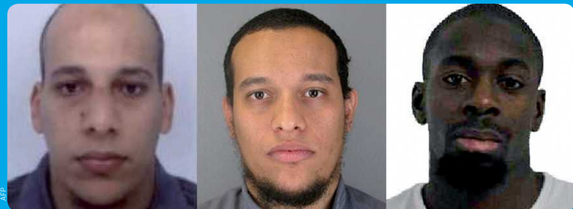
Chérif Kouachi, Saïd Kouachi et Amedy Coulibaly, les responsables des attaques terroristes de la semaine dernière.